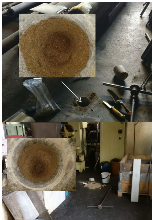
P3 reikä ja hiekkä (yllä) P4 reikä ja hiekkä (alla)