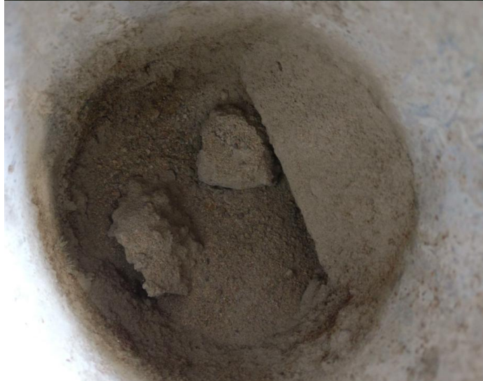
P1 reikä (yläkuva) ja P2 hiekkä rei'ässä.