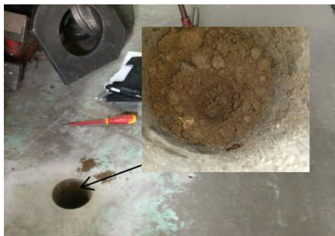
P10 reikä ja hiekka/kiviä