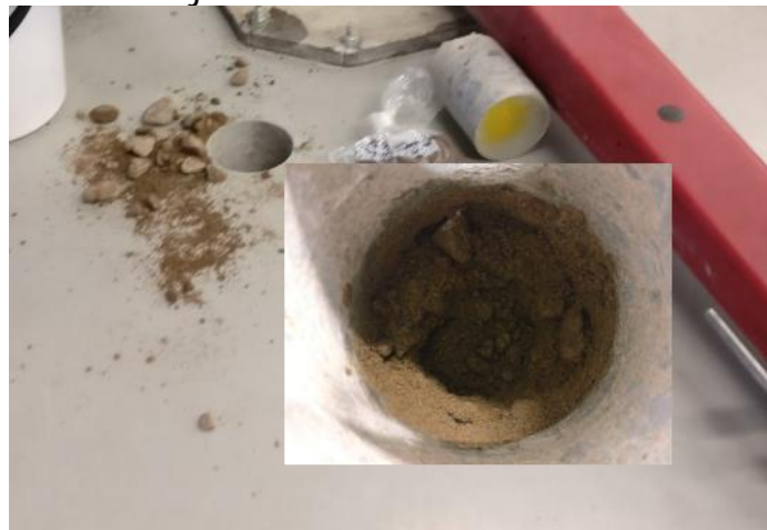
P11 reikä ja hiekka/kiviä