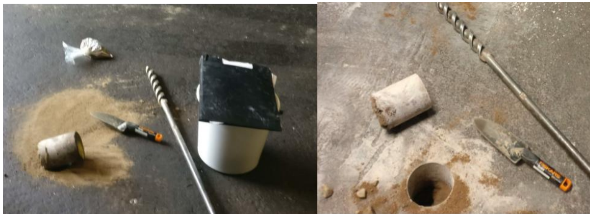
P5 vasemmalla ja P6 oikealla, hiekka