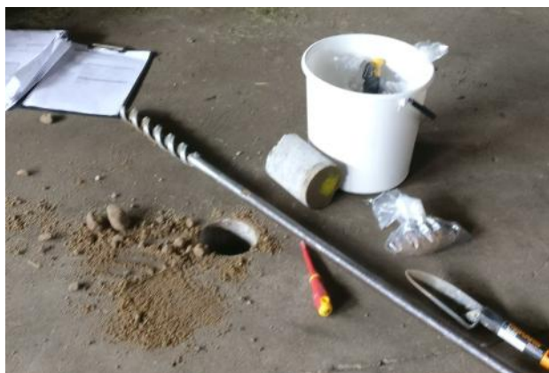
P8 hiekkä ja kiviä